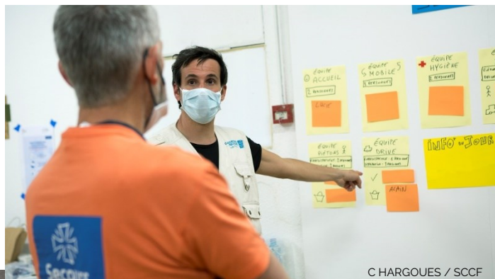
C HARGOUES / SCCF

« Confinés comme tous, trop âgés pour agir sur le terrain comme beaucoup, mais mesurant bien les effets négatifs du contexte sanitaire sur les plus fragiles, nous nous sommes réjouis d'être associés. Il s'agit, depuis notre domicile, de collecter les demandes d'aide provenant des travailleurs sociaux, transmises par internet, puis nous contactons chacune des familles pour fixer la journée et l'heure du rendez-vous au lieu de distribution des colis.